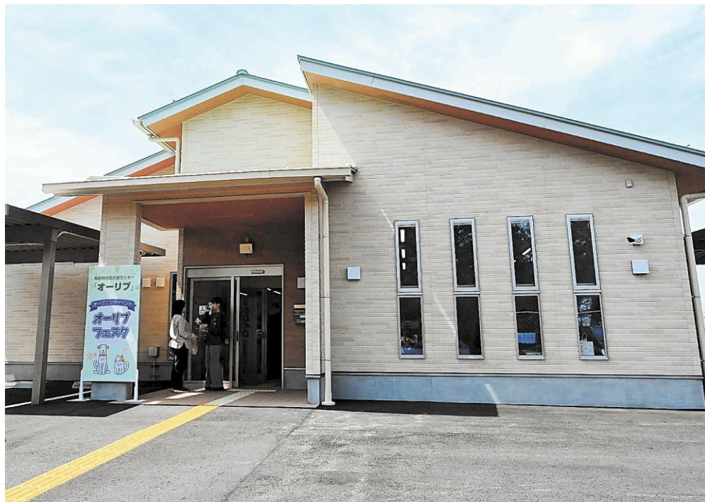
犬猫の保護や動物愛護の啓発を行う県西部犬猫センター「オーリーブ」