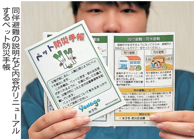
同伴避難の説明など内容がリニューアルするペット防災手帳

市が2021年に作成したペット防災手帳は、しつけや持ち出し品といった日頃の備えや避難所での心構えが書いてあるほか、ペットの名前や特徴、病歴、ワクチンの接種記録などを記入できるようになっている。